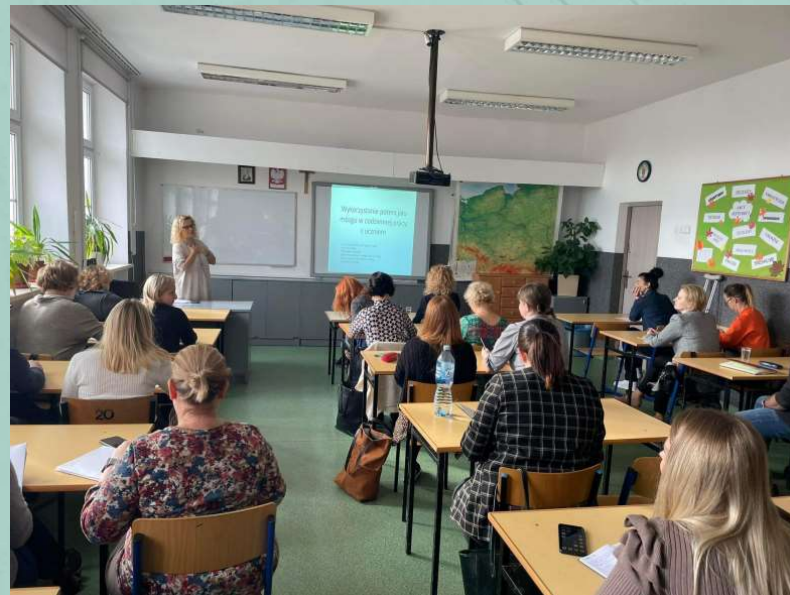
Konferencja: „Zrozumieć i pomóc”