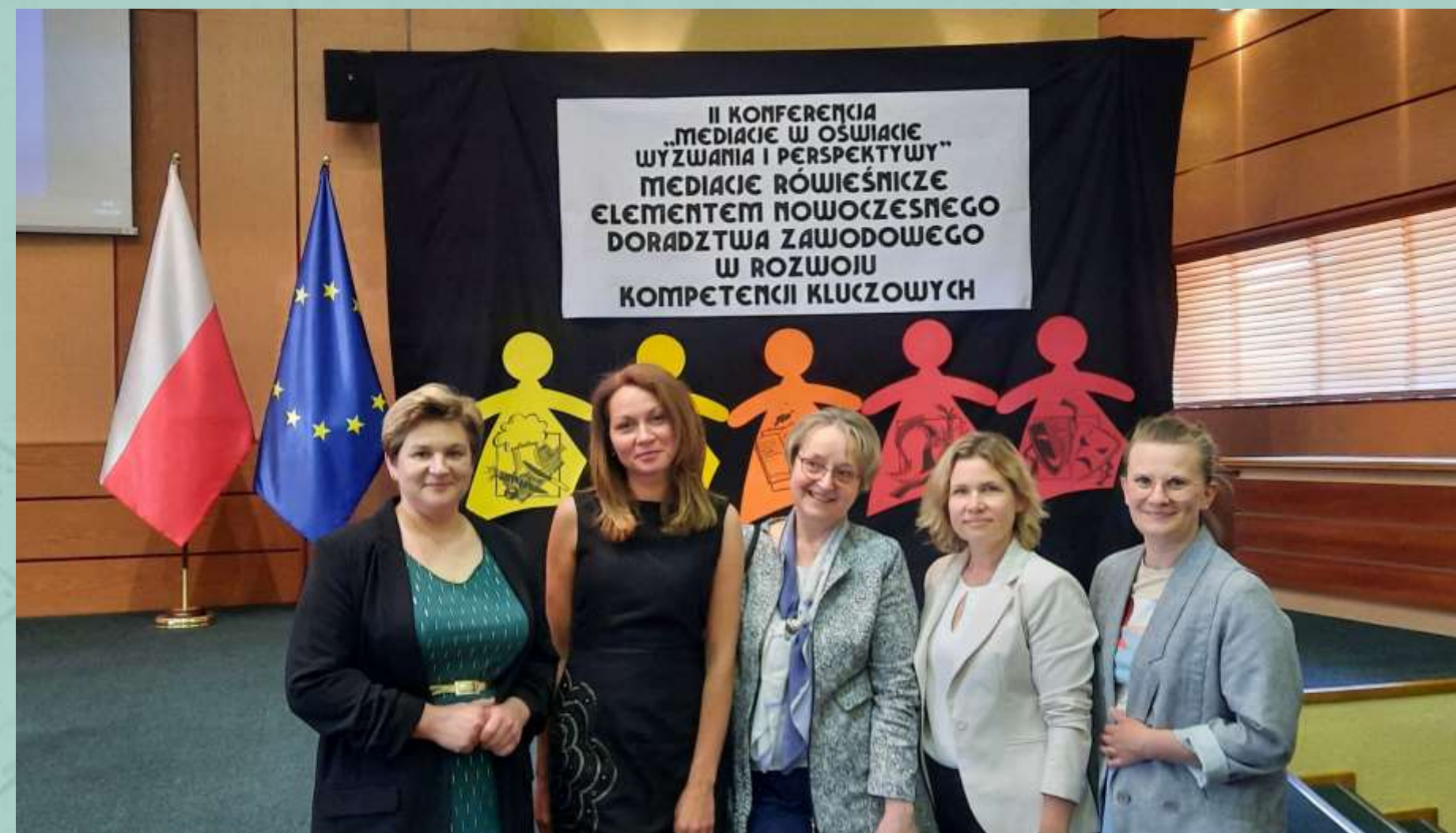
Konferencja: „Mediacje w oświacie”