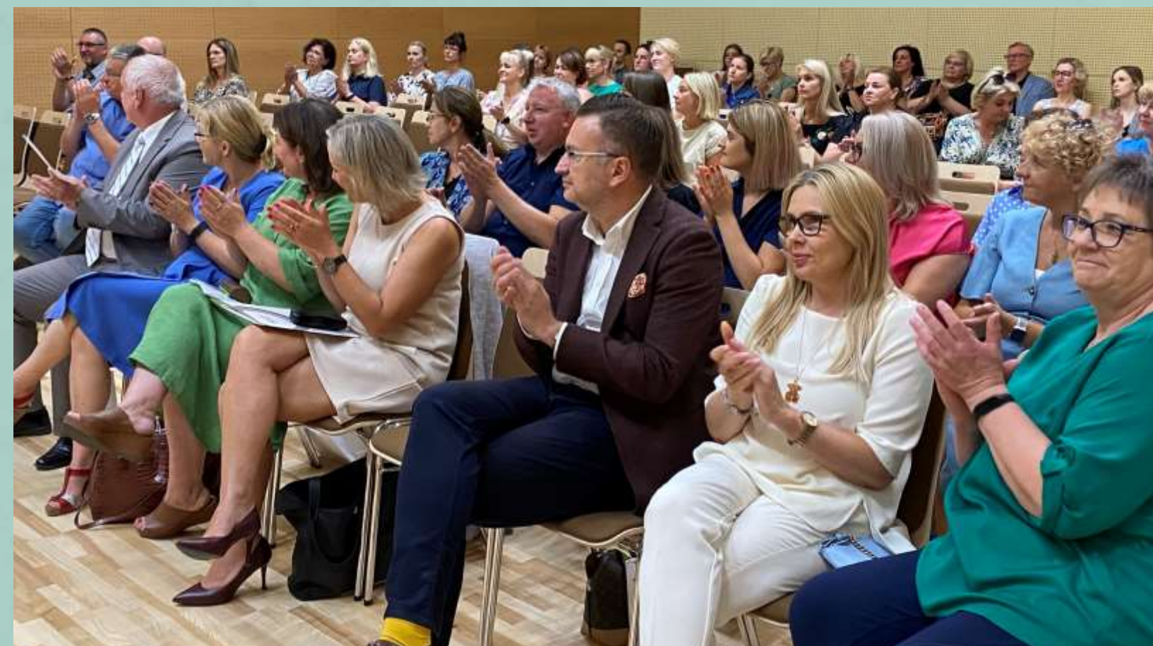
Projekt: „Szkolenie i doradztwo dla kadr PP-P”